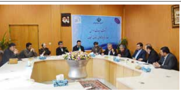
نخستین جلسه هم اندیشی هیئت موسس خانه روابط عمومی استان زنجان برگزار شد

ستاد بازسازی عتبات عالیات استان زنجان در خدمات رسانی به زوار به مدت ۱۰ روز از ۲۰ آبان ماه سال جاری و همزمان با پیاده روی اربعین ادامه داشت. این ستاد روزانه به ۲۰ هزار نفر از زوار در مسیر پیاده روی اربعین خدمات مختلف ارائه کرده است. از جمله این اقدامات می توان به پخت ۳۷۵ هزار پرس غذا در طول ۱۰ روز توسط خادمین حسینیه اعظم زنجان، پخت روزانه ۱۵ هزار عدد نان لواش توسط نانوایان زنجانی، فعالیت پزشکان تحت نظر ستاد بازسازی عتبات