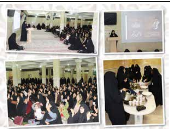
مراسم گرامیداشت وفات حضرت معصومه (س) در حسینیه اعظم زنجان (ویژه خواهران)